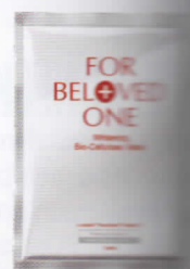
For Beloved One Whitening Whitening Bio-Cell 1 กล่อง/3 วัน 1,000 บาท (จำหน่ายที่ เซ็นทรัล)